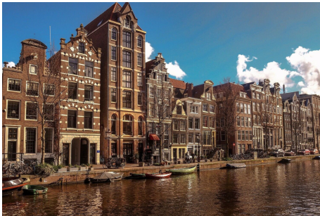
Klassischer Rhein / MS AMADEUS PRINCESS ****

Entdecken Sie die vielseitigen Schönheiten von "Väterchen Rhein", der zu den wichtigsten und zugleich attraktivsten Wasserstraßen Europas zählt. Auf der Kreuzfahrt von Amsterdam an der Nordsee bis Basel am Tor der Schweizer Alpen fahren Sie durch die vier Länder Niederlande, Deutschland, Frankreich und die Schweiz, passieren die windungsreiche Mosel, Weinberge, Burgen und die sagenumwobene Loreley. Dabei lernen Sie sehenswerte Flussmetropolen kennen.