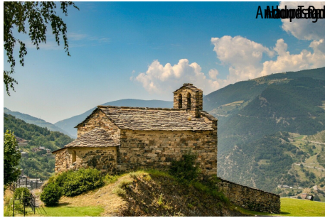
Andorra la Vella